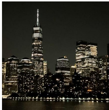
米国・ニューヨーク夜景