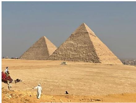
エジプトピラミッド