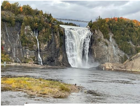
カナダ・ケベック郊外の滝