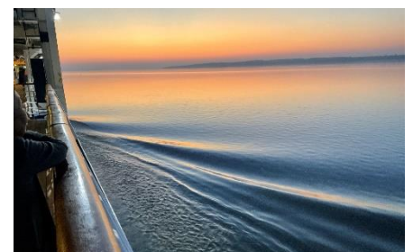
カナダ・セントローレンス川の夕景