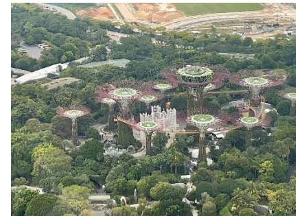
シンガポール眼下の公園