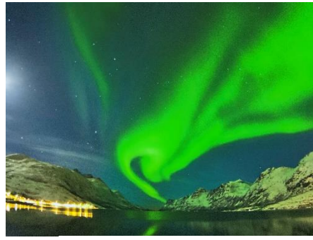
アイスランド・オーロラ