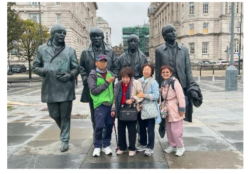
リヴァプール・ビートルズ像と