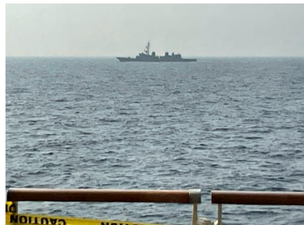
海賊の海で自衛隊の護衛艦が守る