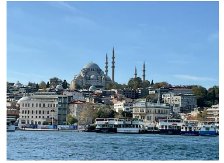
イスタンブールの寺院