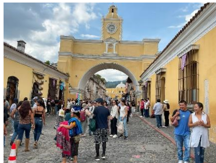
グアテマラ・アンティグア