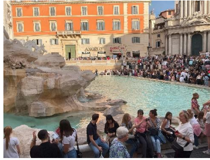
ローマ・トレヴィの泉