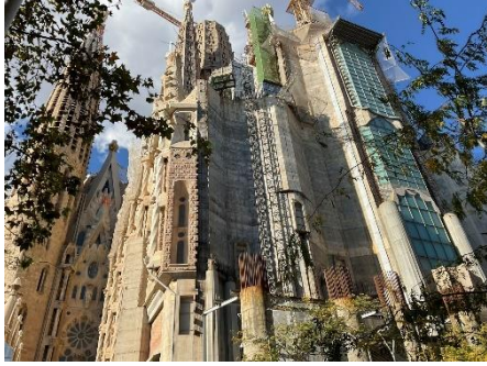
スペイン・サクラダファミリア